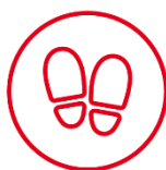
MARQUAGE AU SOL

Ensuite, un sens de circulation, des marquages au sol et une limitation de 1 adulte par enfant devront être respectés.