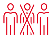
LIMITATION NOMBRE DE PERSONNES

Les enfants se verront attribuer un vestiaire pour la semaine. Celui-ci sera nettoyé et désinfecté chaque jour avant leur venue. Seuls leurs affaires et leurs matériels seront disposés dessus.